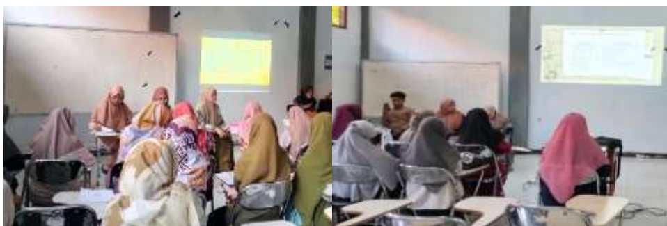
Gambar 2. Dokumentasi kegiatan literasi kultur budaya

Dengan demikian, pendampingan literasi kultur budaya di kampus UNZAH dapat membawa dampak yang positif dalam meningkatkan pemahaman, keterlibatan, dan penghargaan terhadap kultur budaya di kalangan mahasiswa. Hal ini dapat berkontribusi pada pembentukan identitas kultural yang kuat dan mendukung terciptanya lingkungan belajar yang inklusif dan beragam di kampus. Berikut hasil dokumentasi kegiatan literasi kultur budaya terdapat pada gambar berikut.